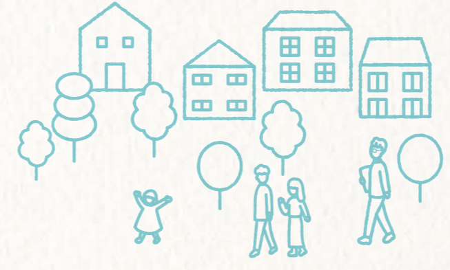
■サイトトップ画面イメージ

イベント告知などでちょっと情報を載せておきたい方には、ご予算に応じたご提案も可能。また年6回以上の広告掲載で回数割引もあり♪お気軽にお問い合わせください。