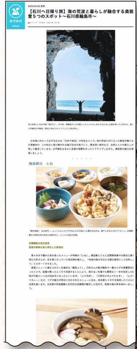
■サイト記事型広告画面イメージ